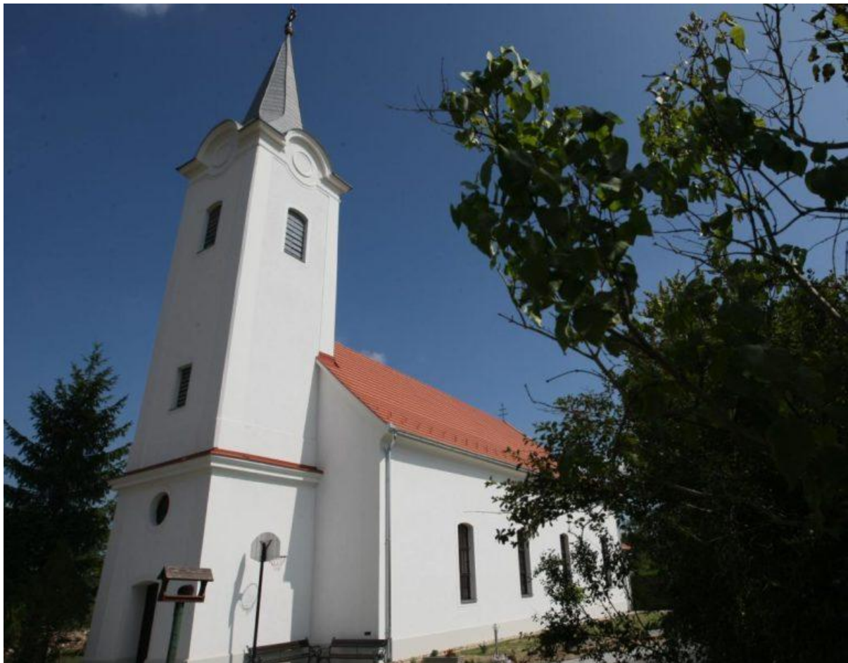
Zalaistvánd szép evangélikus temploma